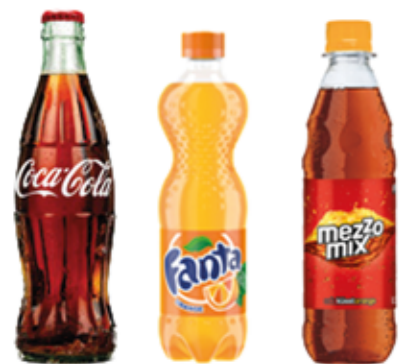
Cola/Fanta 2,70 €* Mezzo Mix 0,5 l