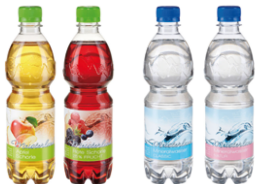
Frucht Schorle 2,60 €* Wasser 0,5 l