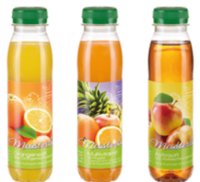
Saft 0,33 l 2,45 €* *zzgl. Pfand