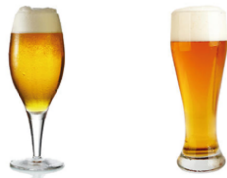
Pils 0,33 l 2,60 €* Hefeweizen 0,33 l 2,60 €*