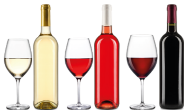
Riesling 0,25 l 3,50 € Rosé 0,25 l 3,50 € Trollinger Lemberger 0,25 l 3,50 €